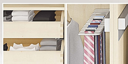
4 HOLZSCHUBKASTEN ENGLISCHER ZUG mit niedriger Frontblende Art.Nr. 557.62.056