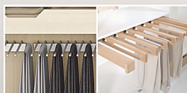
3 HOSENANZUG Art.Nr. 805.45.204