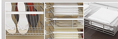
21 SCHUHABLAGE Art.Nr. 805.84.201