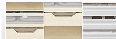
18 GLASFRONTAUSZUG Art.Nr. 557.62.050