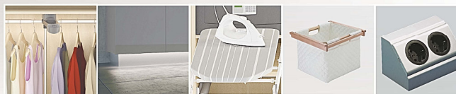
8 ANBAULEUCHTE HALEOS 4032 Art.Nr. 824.07322 schwarz Art.Nr. 824.07522 grau