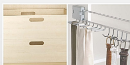
6 STAPELBOX Art.Nr. 557.04.300